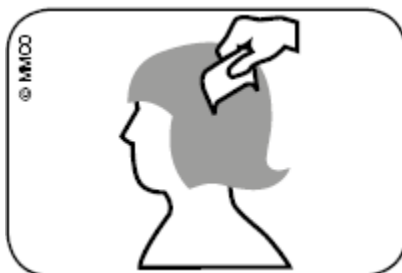
Abb. Durchkämmen des nassen Haars mit Läusekamm vom Haaransatz bis zu den Haarspitzen